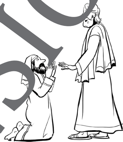
Illustration: Julia Lenzmann

Die zwölf Jünger waren später auch Zeugen des Todes und der Auferstehung Jesu.