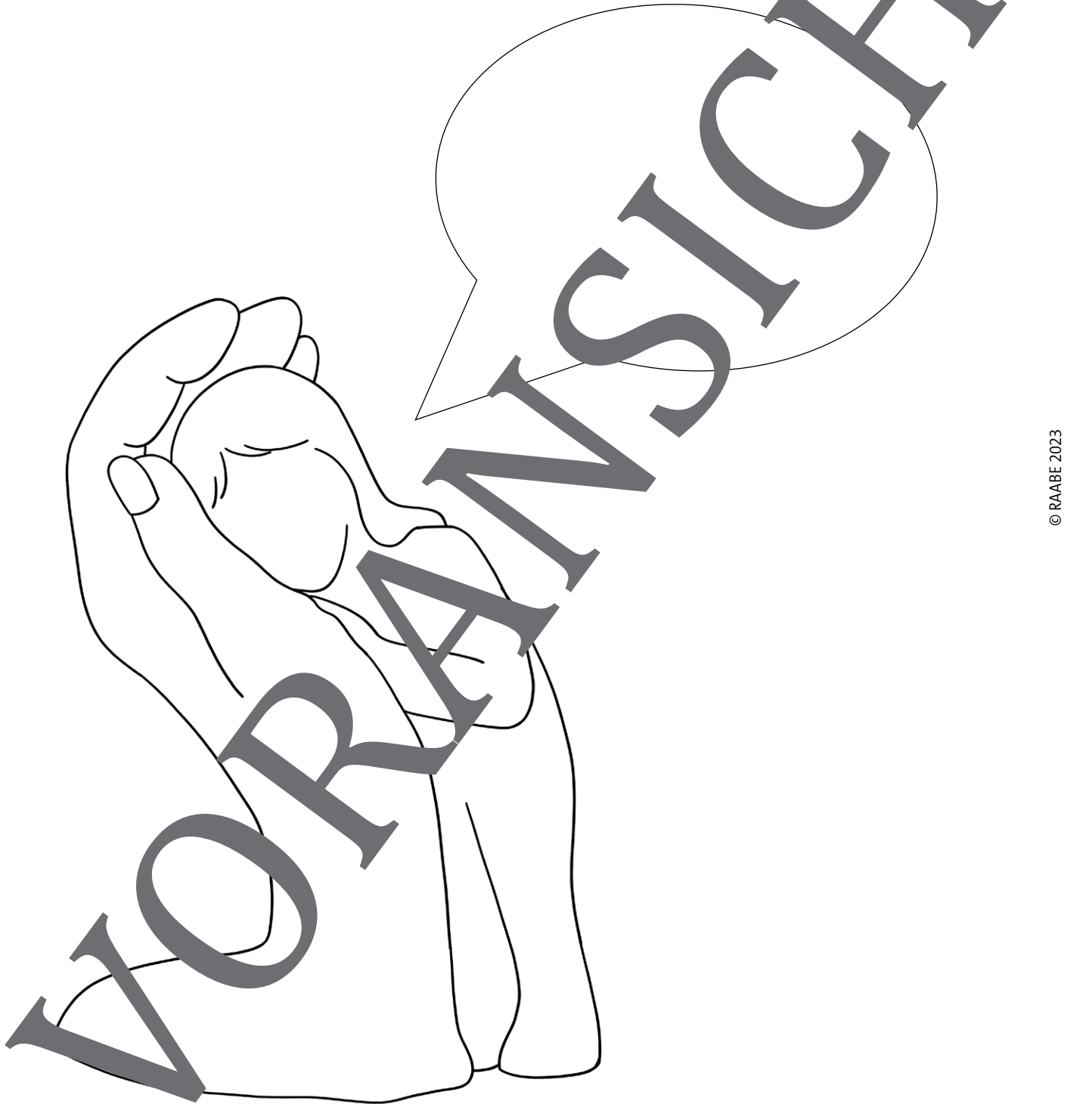
Illustration: Katharina Friedrich

Schreibe in die Sprechblase, wie sich das Kind fühlt.