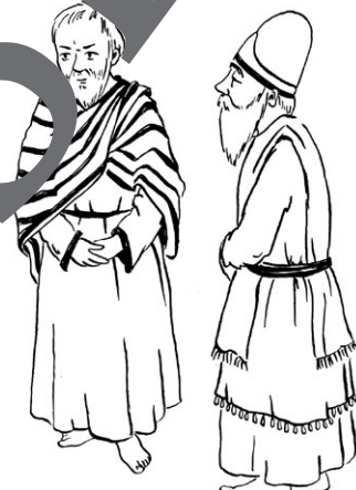
Ratgeber des Königs