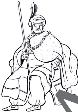
König von Babylon