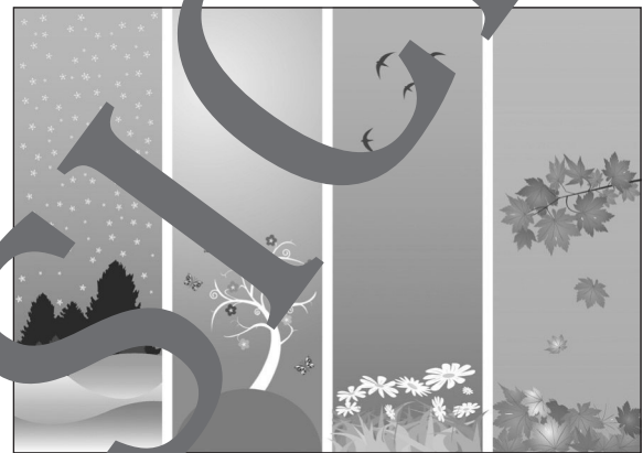
Spring, summer, autumn and winter