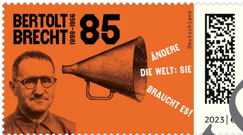
Bertolt Brecht auf einer Briefmarke zu seinem 125. Geburtstag. Entwurf: Matthias Wittig. Zitat: © Bertolt-Brecht-Erben/Suhrkamp Verlag.

Will man einen Wendepunkt in der Geschichte des Theaters markieren, so muss sich eine radikale Politisierung mit einer radikal neuen Form vereinen, so ist hier die Theaterkonzeption Bertolt Brechts zu nennen, die er maßgeblich zwischen 1925 und 1930 unternahm. Durch Verfremdungseffekte und direkte politische Botschaften zielt Brechts „episches“ Theater darauf ab, die Mechanismen des Kapitalismus offenzulegen und das Publikum zur aktiven Auseinandersetzung mit sozialen Ungerechtigkeiten zu bewegen. Der folgende Text „Über das epische Theater“ und beschreibt Brechts Vorstellungen und Ziele hinsichtlich einer neuen, „epischen“ Theaterkonzeption.