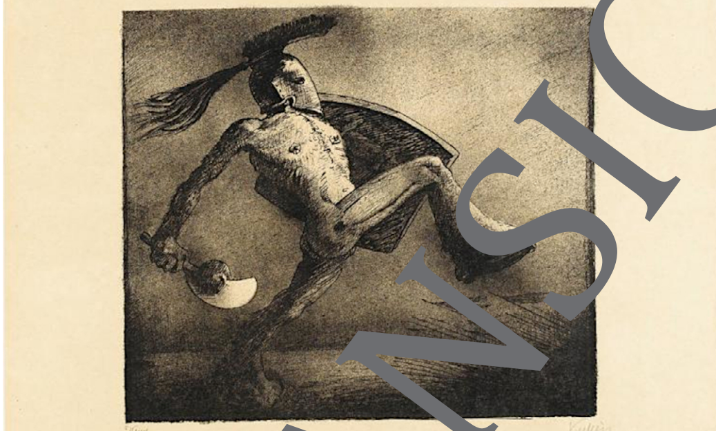
Alfred Kubin: Der Krieg, 1930 © Eberhard Spangenberg, München VG Bild-Kunst, Bonn 2023

In dieser Unterrichtseinheit beschäftigen sich die Lehrerinnen und Schüler mit der Literatur des Expressionismus. Beispiele aus der bildenden Kunst und pragmatische Texte zur Kontextualisierung ergänzen die hier vorgestellten lyrischen und epischen Texte. Die Unterrichtsreihe gewährt Ihren Lernenden einen Einblick in die radikale Suche der Expressionistinnen und Expressionisten nach neuen poetischen Ausdrucksformen und in ihre zängende ernsthafte Auseinandersetzung mit einer krisenhaften Verdrängung der Welt.