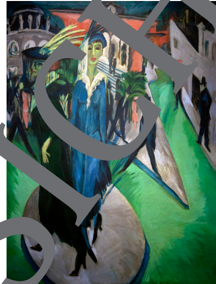
Ernst Ludwig Kirchner: Potsdamer Platz

In: Schmidt-Bergmann, Hansgeorg (Hg.): Lyrik des Expressionismus . Reclam. Stuttgart 2003, S. 132–133.