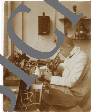
Gottfried Benn im Jahr 1916