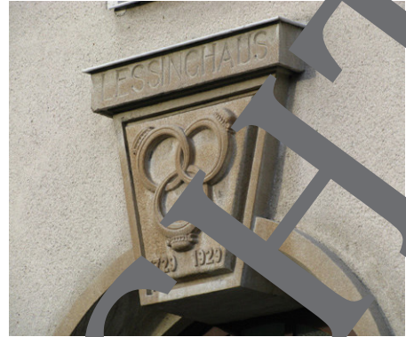
Rechts: Die drei Ringe über dem Eingang des Lessinghauses in Kamenz/Sachsen.

Auf dem Höhepunkt des Dramas, also im III. Akt (Aufzug), findet die Begegnung zwischen Nathan und Saladin statt. Um an Geld zu gelangen, versucht Saladin, Nathan eine Falle zu stellen, indem er diesen nach der wahren Religion fragt. Nathan, der sich in einem Dilemma sieht, antwortet dem Sultan mit einem Märchen: der berühmten Ringparabel.