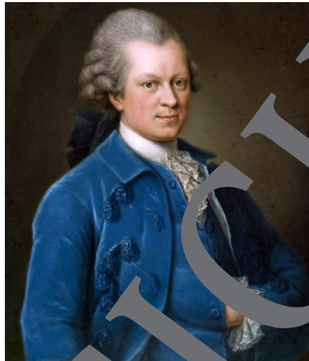
Lessing auf einem Gemälde aus dem Jahr 1767/68

Seit 1770 arbeitet Lessing als Bibliothekar in der Herzog-August-Bibliothek in Wolfenbüttel und veröffentlicht hier ab 1774 die „Fragmente eines Ungenannten“. Es handelt sich um Auszüge aus dem religionskritischen Werk des Hamburger Gelehrten und Orientalisten Hermann Samuel Reimarus, die Lessing als einen Bibliotheksfund ausgibt und die für große Empörung in der theologischen Öffentlichkeit sorgen. Insbesondere mit dem Hauptpastor der Katharinenkirche in Hamburg, Johann Melchior Goeze, gerät Lessing in einen erbitterten rhetorischen Zweikampf, der als „Fragmentenstreit“ bezeichnet wird und schließlich zu einem Publikationsverbot für Lessing führt. Lessing umgeht die Zensur, indem er das Drama „Nathan der Weise“ schreibt.