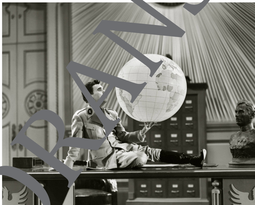
Charlie Chaplin als Diktator im Film „The Great Dictator“ (Der große Diktator) 1940