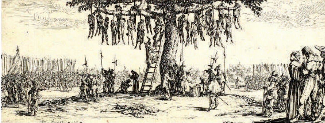
Jacques Callot: „Der Galgenbaum“ (1632)

Maler und Dichter verarbeiteten das Geschehen um sie herum. Hier sind zwei Beispiele: