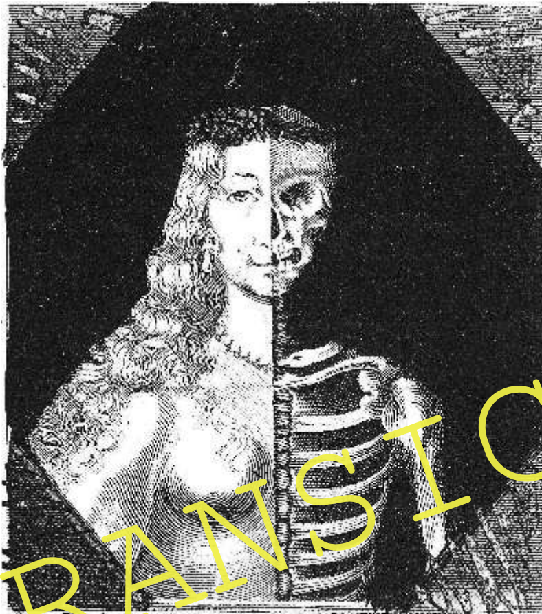
„Le miroir de la vie et de la mort“, Kupferstich eines anonymen Künstlers, 17. Jahrhundert. Musée Carnavalet, Paris.

Lebensgenuss im Angesicht des Todes? – Die Ästhetik des Barock wirkt auf den ersten Blick widersprüchlich