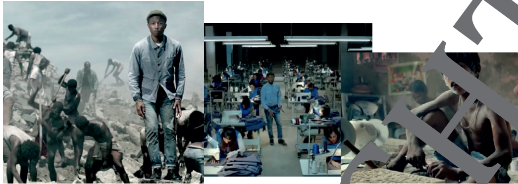
Pharrell Williams: Freedom, video clip directed by Paul Hunter, Apple Music, Columbia Records/Sony Music Entertainment, found at https://www.youtube.com/watch?v=LIY90IG_Fuw .