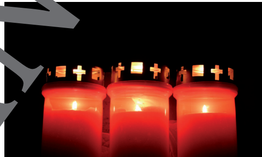
Candles on grave during All Saints's Day

By 43 A.D., the Romans had conquered a great part of the Celtic territory. The Romans were _____ and no longer tolerated the superstitious 3 celebrations of Samhain. On 1 st November the Catholics celebrate All Saints' Day, a day to honour the saints 4 . Later, in 1000 A.D., the Catholic Church made 2 nd November a day to honour the dead and called it All Souls' Day. All Souls' Day was celebrated similarly to Samhain. People lit _____ and dressed up in costumes as angels and _____. Another word for "saint" is "hallow" and this is how 31 st October became "All Hallows' Eve", the evening before All Saints. Language changed and so "All Hallows' Eve" became "Hallowe'en" or _____ as we know it today.