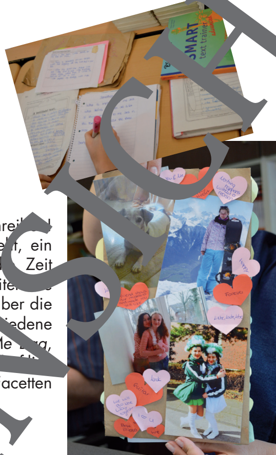
Freunde, Hobbys, Familie? – Die Me Bag zeigt, was mich ausmacht.