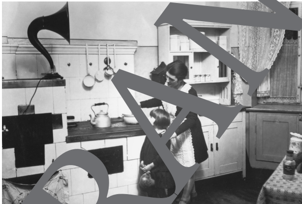
No. 2 Housewife and her child in the kitchen, listening to the radio (1925)