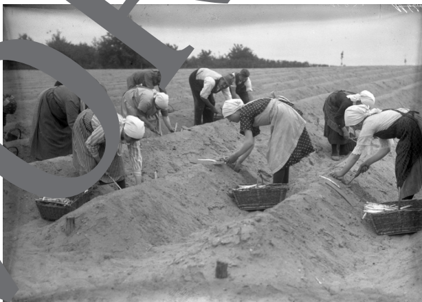
No. 3 Agricultural workers cutting asparagus 1 in Brandenburg (1929)