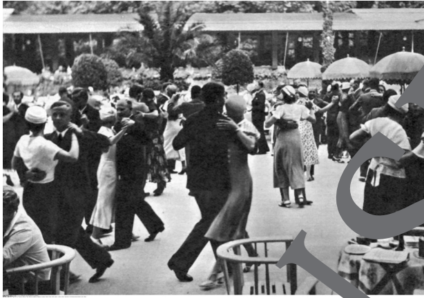
No. 1 Tea dance at the "Krollplatz" in Berlin (End of 1920s)