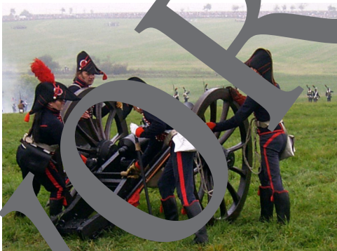
A Re-enactment 2 of the battle of Jena and Auerstedt (2006) with Participants from all over the world