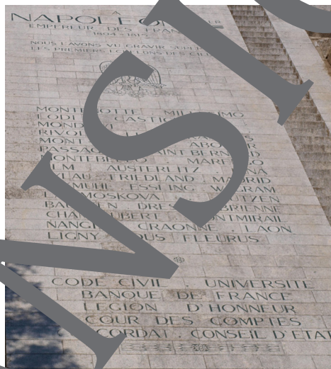
The list contains Napoleon's successes like victories in battle, the Code Civil and the foundation of the Banque de France