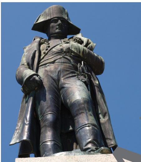
A monument in Ajaccio, Corsica (1938)