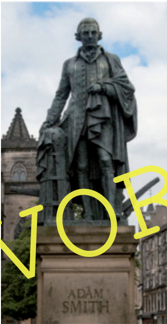
© Wikipedia/Alexander Stoddart, CC BY-SA 4.0