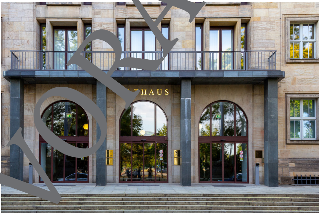
© Michael Persson/iStock Editorial/Getty Images Plus

Quelle: Bühl, Achim: Rassismus. Anatomie eines Machtverhältnisses . Marix Verlag, Wiesbaden 2016. S. 227.