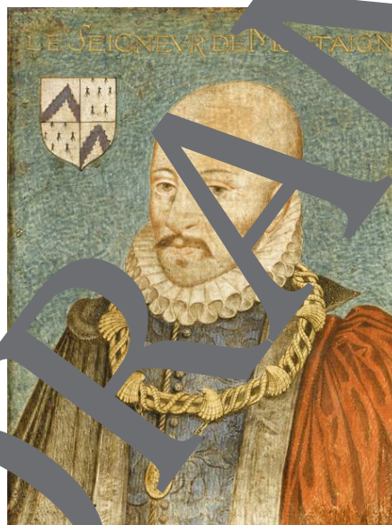
Michel de Montaigne auf einem zeitgenössischen Portrait von Thomas de Leu (1580–1612).