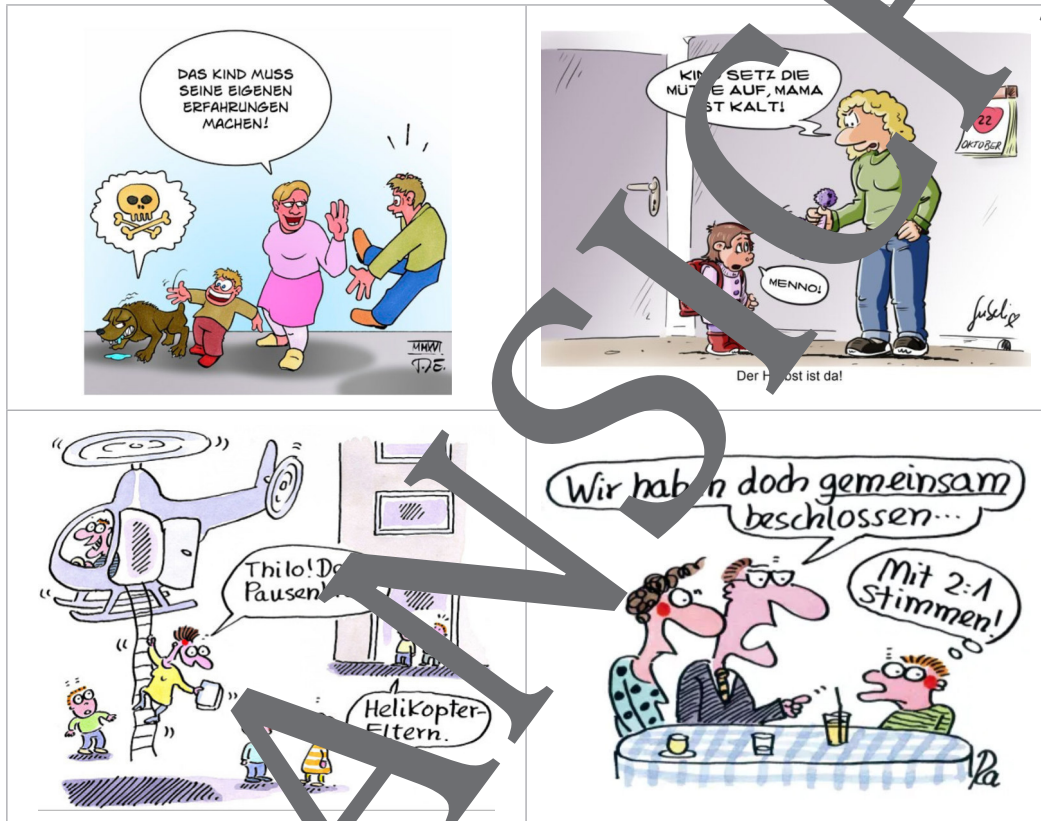
Karikaturen von links oben nach rechts unten: © Timo Essner; Lars Bublitz; Renate Alf (beide)