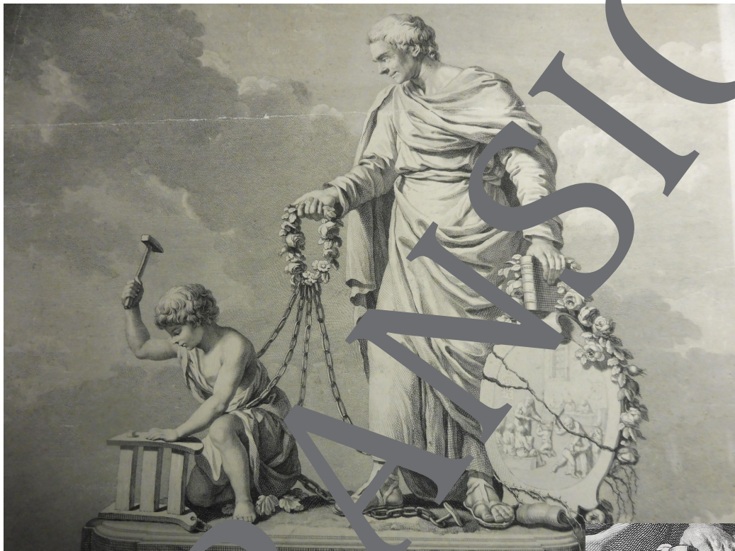
© Kupferstich von Le Barbier, gemeinfrei