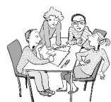
Grafiken: Julia Lenzmann