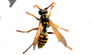
Polistes dominula Gallische Feldwespe