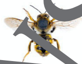
Anthidium manicatum Wollbiene