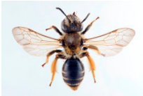
Andrena lathyri Sandbiene