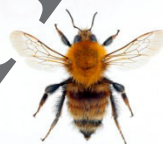
Bombus humilis Veränderliche Hummel

Abbildung 1: Insektenammlung mit Originalen.