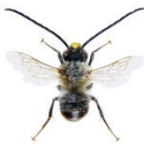
Eucera nigrescens Langhornbiene