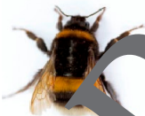
Bombus terrestris Erdhummel