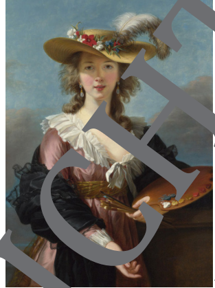
É. V. Le Brun, 1882, Musée de la Ville de Paris

https://www.beauxarts.com/encyclo/elisabeth-vigee-le-brun-en-2-minutes/ [dernier accès 4.6.2021]