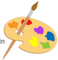
participer à un cours de dessin