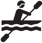
faire du kayak