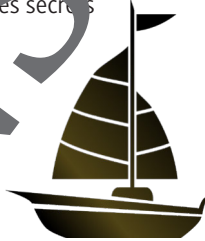
faire un tour en bateau