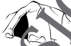
visiter des grottes / des passages secrets