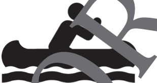
faire du canoé