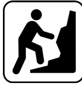
faire de l'escalade