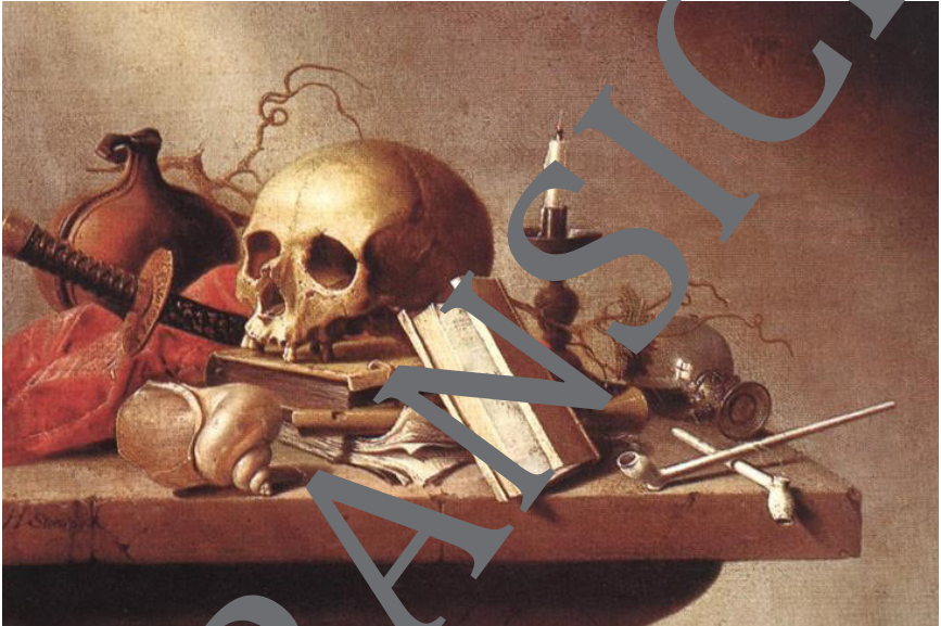
Harmen Steenwijk, Vanitas , ca. 1640

Der literarische Barock steckt voller (scheinbarer) Widersprüche: Tod, Zerstörung und die Hoffnung auf Erlösung im Jenseits auf der einen Seite – der Aufruf zum Genuss, zur Liebe und zu Genesfreuden in Diesseits auf der anderen Seite. Wie passen diese Gegensätze zusammen? In dieser Reihe untersuchen Ihre Schülerinnen und Schüler barocke Gemälde und Stillleben, setzen sich mit der Bild- und Symbolsprache des Barock auseinander und erarbeiten Grundkenntnisse über den Dreißigjährigen Krieg, dessen grausame Realität den Erfahrungshorizont vieler Barockdichter bildete. So können sie sich ein anschauliches Bild der Geschehnisse vor 400 Jahren machen und erwerben die nötigen Kompetenzen, um sich lyrische Texte des Barock analysierend und interpretierend zu erschließen.