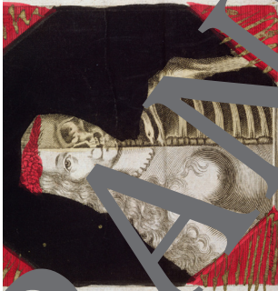
„Le miroir de la vieillesse de la mort.“ Kupferstich eines anonymen Künstlers, 17. Jahrhundert. Musée Carnavalet, Paris.