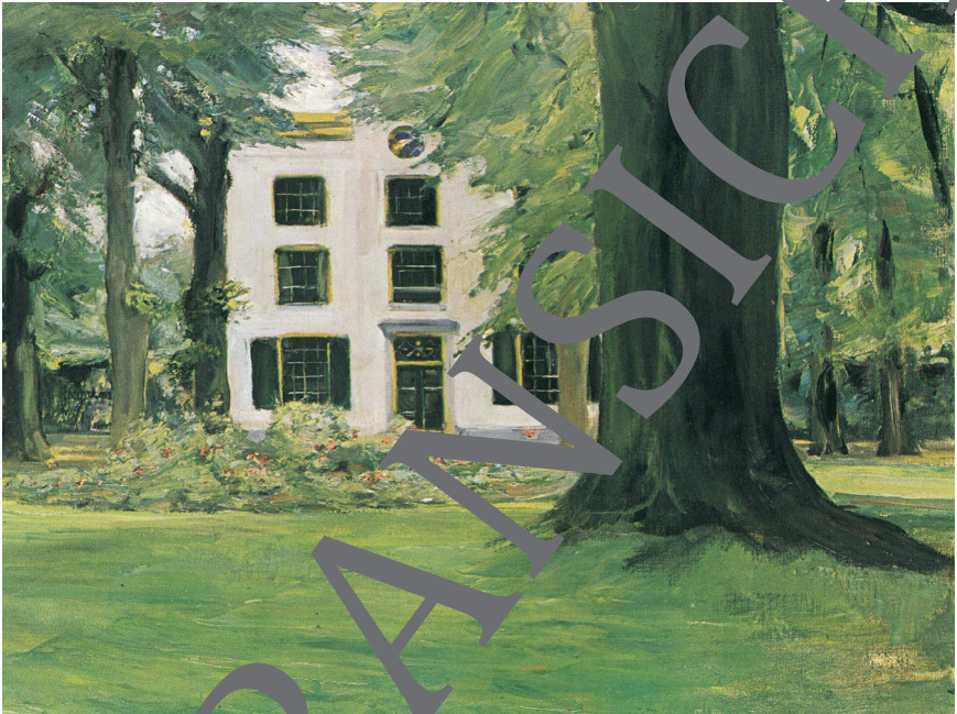
Max Liebermann: Das Haus in der Dorotheenstraße , 1901, Berlin, Nationalgalerie