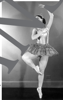
Patientin 4