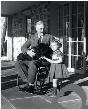
Patient 3: Franklin D. Roosevelt