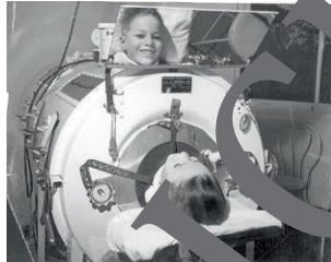
Patient 2: der Eisen-Lunge