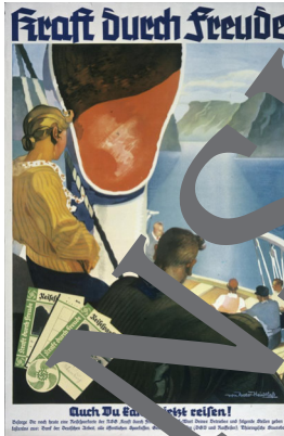
b) Werbeplakat des KdF-Amtes 1937