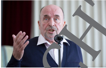
Abb. 2: Rainald Eppelmann