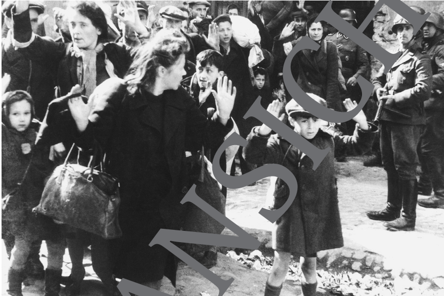
1943 April-Mai

Die Unterrichtseinheit gliedert sich in zwei Blöcke. Im ersten stehen die juristische Aufarbeitung und der Umgang mit den Tätern in der Zeit unmittelbar nach dem Nationalsozialismus bis in die Gegenwart im Mittelpunkt, im zweiten, die Auseinandersetzung mit Fotos als historische Quellen. Beide Teile der Unterrichtseinheit verfolgen einen akteurzentrierten Ansatz. Folglich wird die Geschichte des Holocaust und die Geschichte der Täter als eine individuelle, authentische Geschichte von Menschen betrachtet, deren Lebenslauf zugleich in den historischen Gesamtkontext eingebettet wird. Das bedingt, dass die Arbeit mit Fallbeispielen eine besondere Relevanz zukommt. Diese haben den Vorteil, dass sie für die Lernenden sehr eingängig sind, die Arbeit an ihnen motiviert und die Entscheidungskompetenz der Schüler am konkreten Beispiel erleichtert wird.