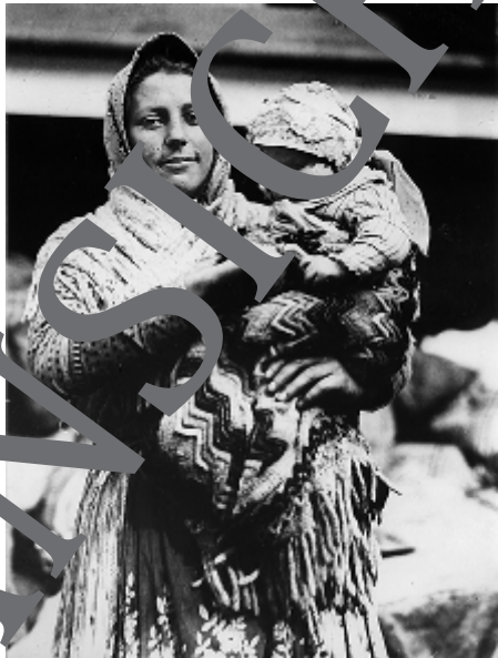
Deutsche Auswandererin mit Kind, ca. 1892/1910