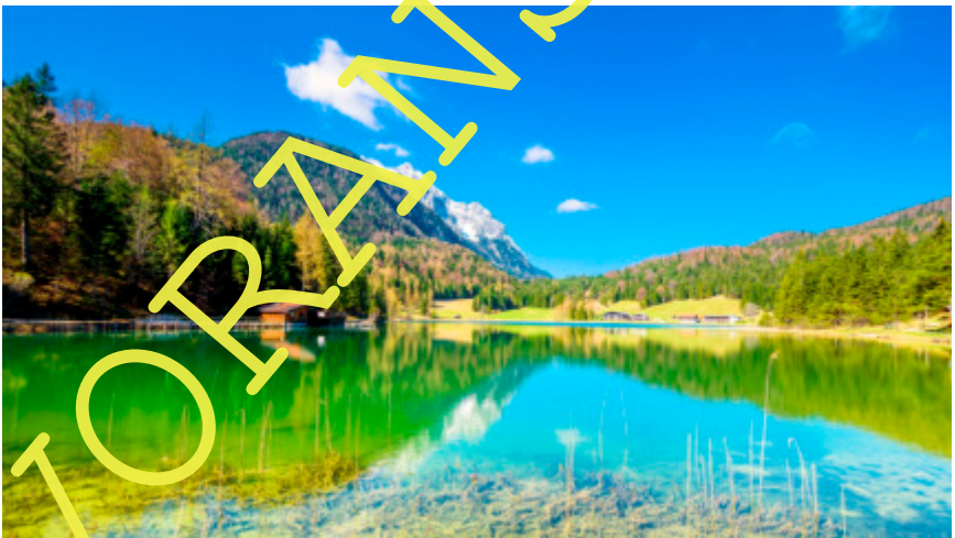
Lautersee bei Mittenwald