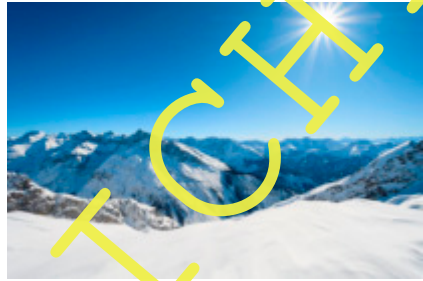
Karwendel im Winter