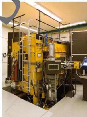
Protonenzyklotron an der University of Washington

Kohlenstoff-11 ist eines der kurzlebigsten medizinischen Nuklide: Seine Halbwertszeit beträgt nur 20 Minuten. Auch dieses Nuklid wird in der Klinik im Zyklotron produziert – durch Bestrahlung von Stickstoff mit Wasserstoffkernen. Noch kürzer lebt Sauerstoff-15, das wie Kohlenstoff-11 und Fluor-18 beim Zerfall ausschließlich Positronen aussendet und daher für PET-Aufnahmen genutzt wird. Sauerstoff-15 hat eine Halbwertszeit von gerade mal zwei Minuten.