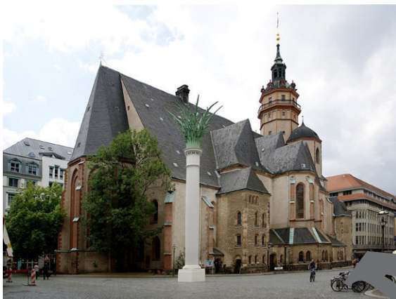
3. Nikolaikirche Leipzig