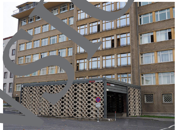
4. Stasi-Zentrale Normannenstraße