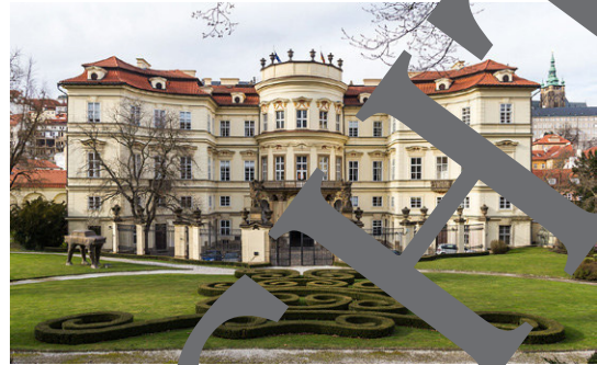
2. Deutsche Botschaft in Prag