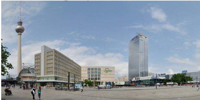
1. Alexanderplatz Berlin