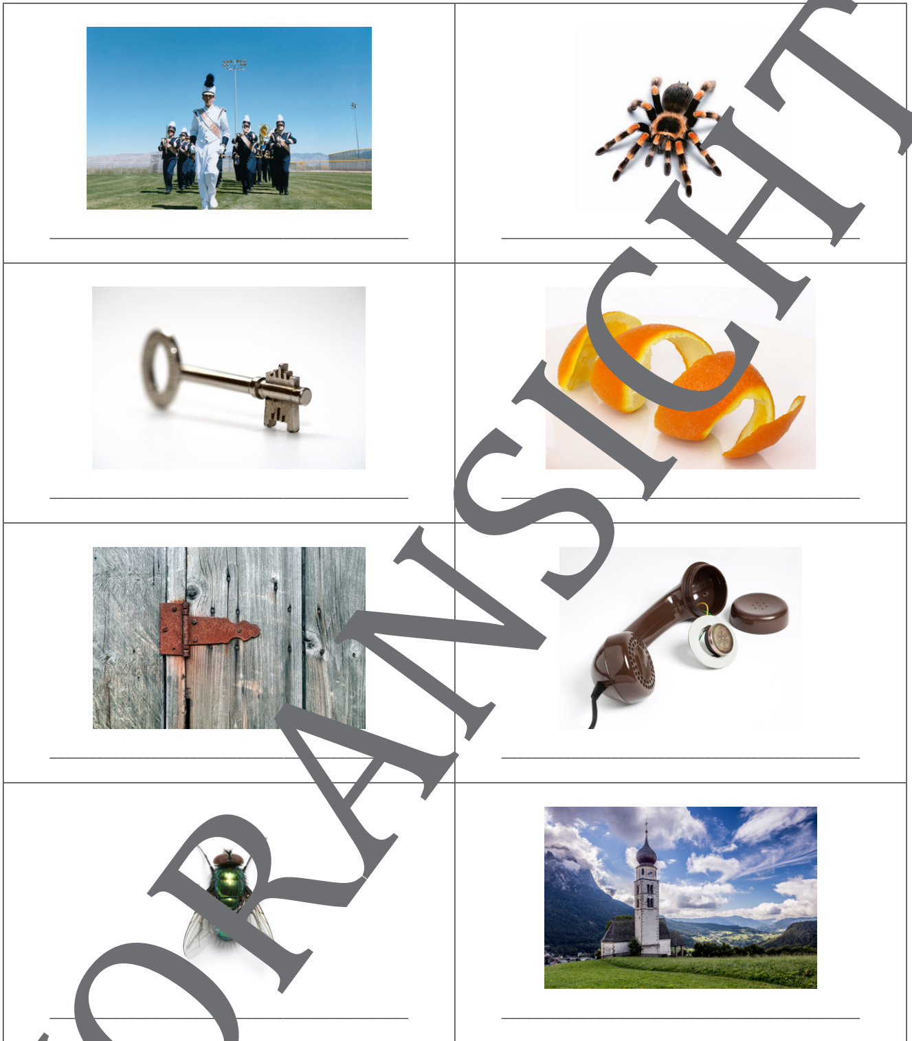
Bild 1: ; Bild 2: ; Bild 3: ; Bild 4: , Bild 5: ; Bild 6: ; Bild 7: ; Bild 8: