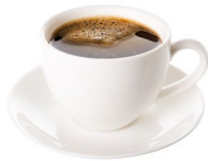
a) der Kaffee

Bier – Cola und Limonade – Fruchtsaft – Kaffee – Milch – Mineralwasser – Schnaps – Tee – Wein