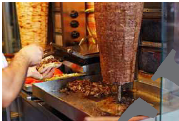
der Imbiss die Imbisse