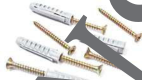
der Dübel die Dübel