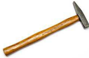
der Hammer die Hämmer