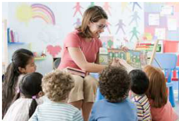
die Kita die Kitas