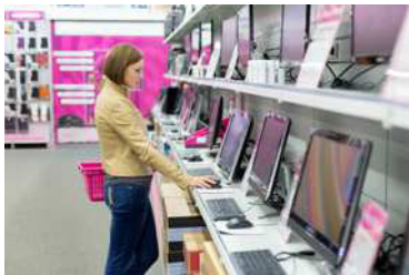
der Computerladen die Computerläden