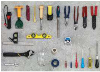
das Werkzeug die Werkzeuge