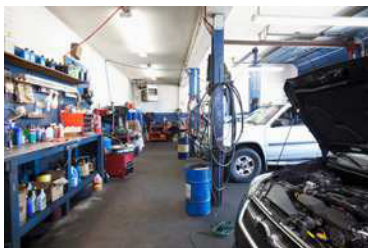
die Werkstatt die Werkstätten