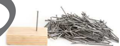
der Nagel die Nägel