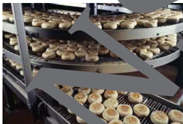
die Fabrik die Fabriken