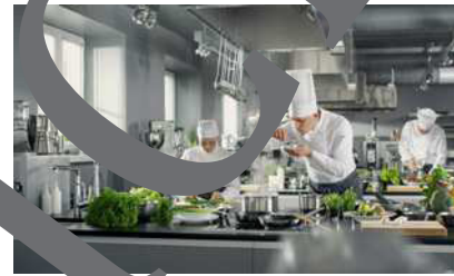
die Küche die Küchen