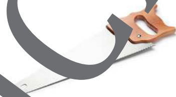
die Säge die Sägen