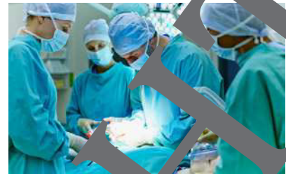
das Krankenhaus die Krankenhäuser