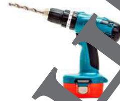
die Bohrmaschine die Bohrmaschinen