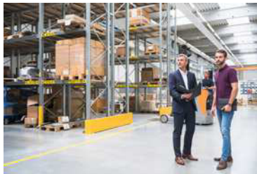
das Lager die Lager