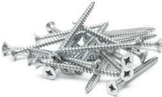
die Schraube die Schrauben