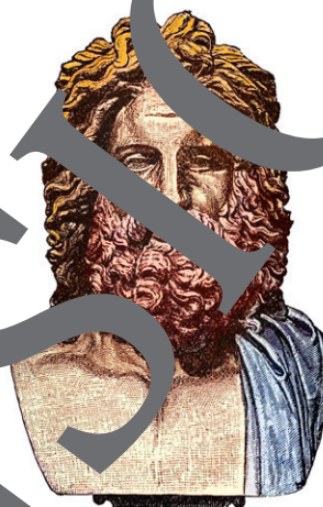
COLOSSAL HEAD OF ZEUS.