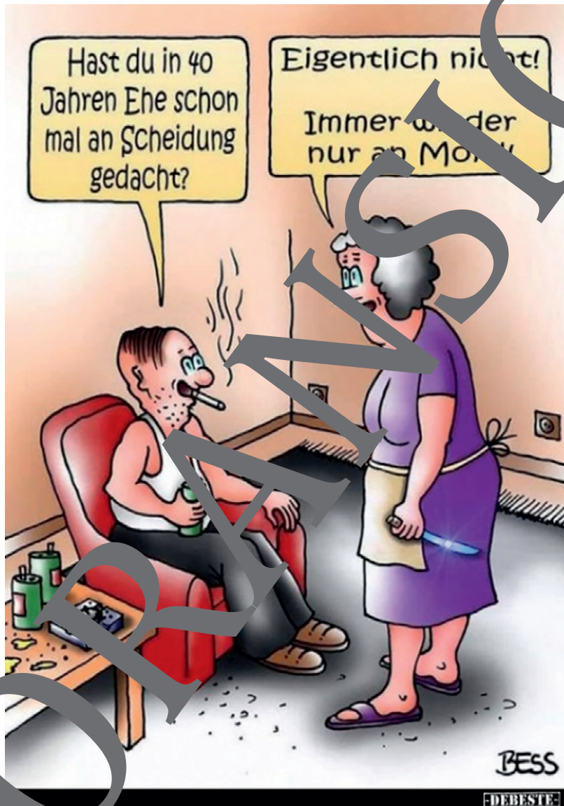
Karikatur von Winfried Besslich/Besscartoon