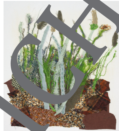
Textilische Umsetzung des Rasenstücks

G rünanlagen, Fußballplätze, Freibäder – Rasenstücke sehen wir täglich. Aber wann nehmen wir uns schon einmal die Zeit, sie ganz genau zu betrachten?! Albrecht Dürer hat das getan und u. a. „Das große Rasenstück“ gestaltet. Sein Werk sowie eine kleine Naturstudie werden in dieser Unterrichtseinheit als Gestaltungsanlässe genutzt. Die Schüler experimentieren mit Stoffen, Wolle und Garn und setzen ihre Erfahrungen anschließend in einer Collage um. Wirklich verblüffend, wie gut sich textile Materialien für die Gestaltung von Pflanzen, Gräsern und Wurzelwerk verwenden lassen!