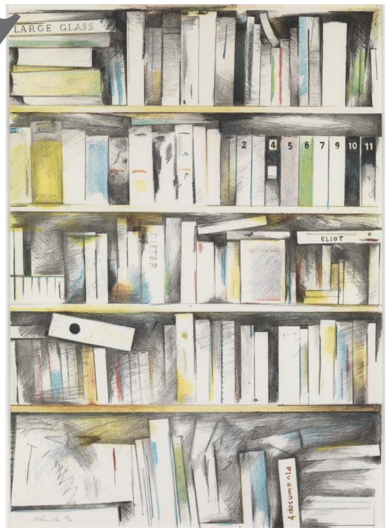
Richard Hamilton: Archive I, 1981 © Estate of Richard Hamilton/VG Bild-Kunst, Bonn 2024