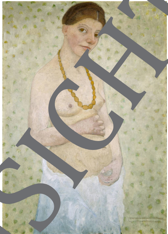
Egon Schiele: Selbstbildnis am 6. Hochzeitstag, 1906