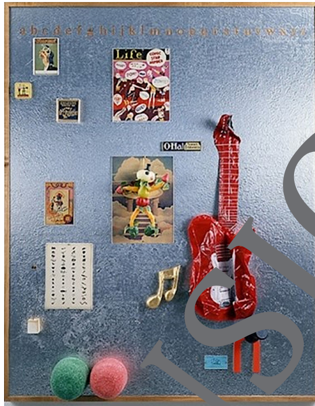
Emmett Williams: Porträt von Claes Oldenburg, © Estate of Emmett Williams