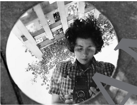
Vivian Maier: Selbstporträt, 1953