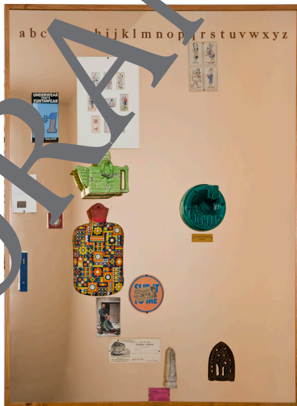
Emmett Williams: Porträt von Richard Hamilton, 1992