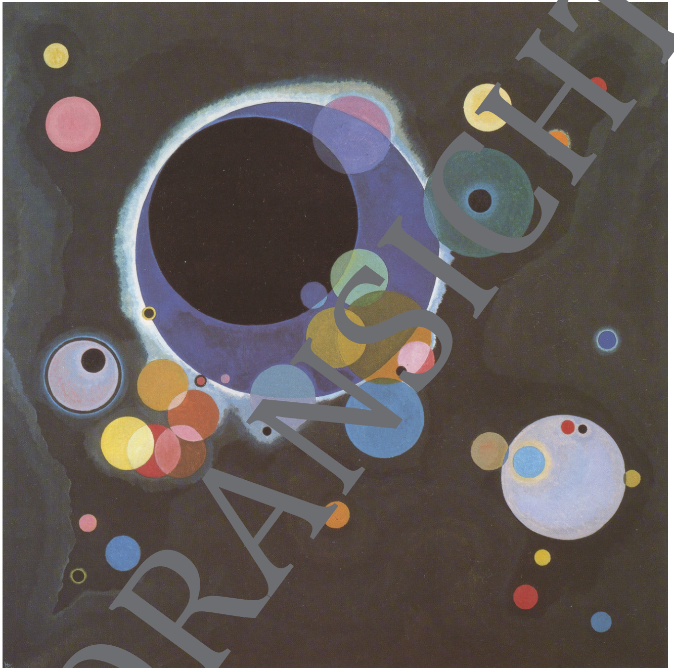
Wassily Kandinsky: Einige Kreise, 1926; Öl auf Leinwand, 140,3 x 140,7 cm; Solomon R. Guggenheim Museum, New York