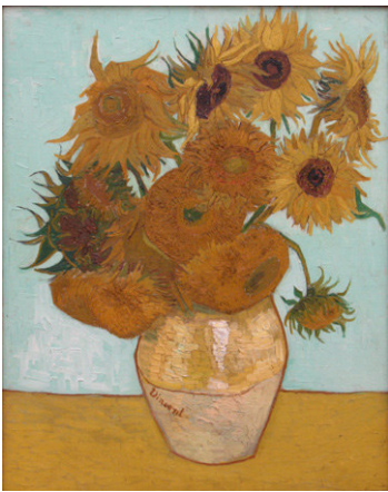
Vincent van Gogh

Als Vorlage benutzt Sie Fotos oder Gemälde. Das Vorbild hier ist vom berühmten Künstler Vincent van Gogh.