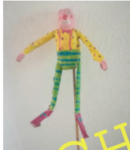
Manege frei für den Clown!

Clowns, die uns zum Lachen bringen, Magier, die uns verzaubern, oder Artisten, die atemberaubende Kunststücke präsentieren – die Welt des Zirkus fasziniert wohl die meisten Kinder. Nutzen Sie diese Begeisterung, wenn Sie die Schüler ihren eigenen „Star in der Manege“ gestalten lassen. Mit den Techniken, die in dieser Unterrichtseinheit vorgestellt werden, ist das ganz einfach und gelingt sicher. Am Ende heißt es dann „Manege frei!“ und Clowns und Co sind bereit für ihren großen Auftritt.