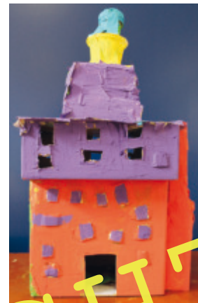
Hier haben Zweitklässler hoch hinaus gebaut