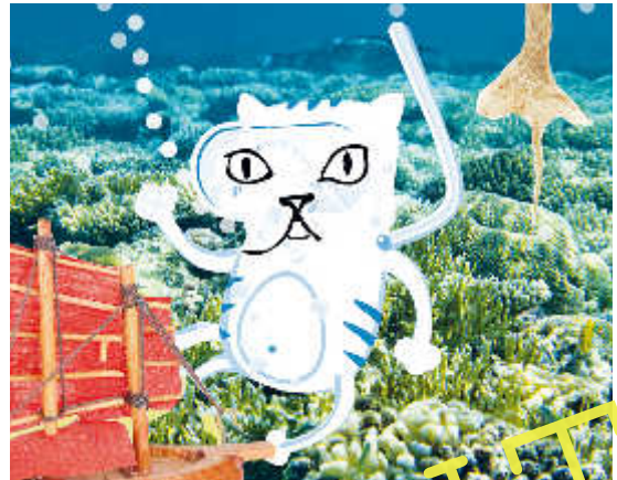
Ich würde in die Südsee fliegen zum Tauchen.

Wohin würde meine Reise gehen, wenn ich fliegen könnte? – Ganz bestimmt werden sich auch Ihre Schüler gern mit dieser Frage auseinandersetzen. In Anlehnung an das Bilderbuch „Wolkenbrot“ entwerfen die Kinder fantasievolle Bilder und Kulissen, die sie mithilfe einer Kamera und der Assemblage zu eindrucksvollen Bilderbuchseiten gestalten. Geben Sie den Kindern mit dieser Unterrichtseinheit die Chance, den Umgang mit neuen Medien in kunstästhetischem Zusammenhang zu lernen und sich dabei von der koreanischen Illustratorin Hee Na Baek inspirieren zu lassen.