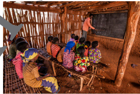
Bild 1 Bild 2 Bild 3 Bild 4

Bildet Paare. Geht durch eure Schule. Notiert Aspekte, die nicht zur Chancengleichheit beitragen. Berücksichtigt dabei Beeinträchtigungen, Kinder mit anderer Muttersprache etc.