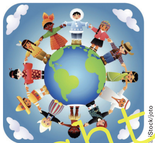
Kinder der Einen Welt

Die Situation von Kindern in Deutschland und anderen Ländern, die oftmals als „Länder der Dritten Welt“ bezeichnet werden, unterscheidet sich massiv. Ein signifikanter Unterschied wird beispielsweise hinsichtlich der Schulbildung deutlich. In Deutschland gibt es die Schulpflicht, die gewährleisten soll, dass Kinder Bildung erfahren. In Ländern wie Guatemala gibt es eine solche Schulpflicht nicht. Bildung ist daher nicht selbstverständlich und besonders in ländlichen Gegenden nicht besonders ausgeprägt. Bei diesem Lernzirkel steht selbstständiges Arbeiten der Schüler in Einzel- und/oder Gruppenarbeit im Vordergrund. Anhand abwechslungsreicher Materialien erhalten die Schüler einen Einblick in das Leben guatemaltekischer Kinder und setzen sich mit christlichen Werten auseinander. Unterschiedliche Lernwege und abwechslungsreiches Arbeiten an Stationen fördern den Lernprozess durch „Lernen mit allen Sinnen“.