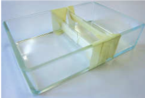
Abb. 2: Einfacher Modellaufbau von Absetzbecken und Fettfang aus einer pneumatischen Wanne, Klebeband und Objektträgern (das Einkleben der Objektträger dauert etwa 3 Minuten)