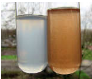
Abb. 3: Links die Limonadenlösung nach Behandlung mit viel Luft (um Braunstein auszufällen) und etwa zwei Körnern Oxidationsmittel ( \text{KMnO}_4 , ggf. mit Thiosulfat entfärben) und rechts nach der Zugabe von etwa 2 Tropfen Eisen(III)-chloridlösung. Gut erkennbar sind hier die großen Flocken, die recht schnell zu Boden sinken. Die Mengenangaben beziehen sich auf das hier gezeigte Volumen von etwa 10 ml (großes Reagenzglas).