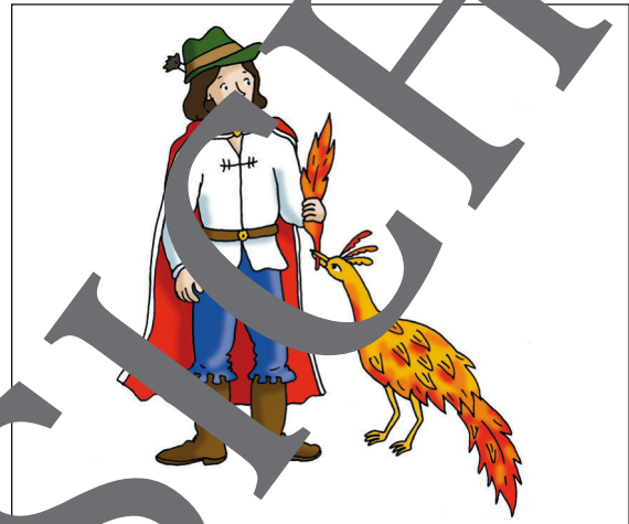
Iwan erhält die magische Feder

Ihre Schüler erhalten in dieser Unterrichtseinheit einen handlungsorientierten und kreativen Zugang zu diesem Werk und erschließen Auszüge aus einem berühmten Ballett. Sie setzen ihre Höreindrücke kreativ in Klangimprovisationen und szenischem Spiel um.