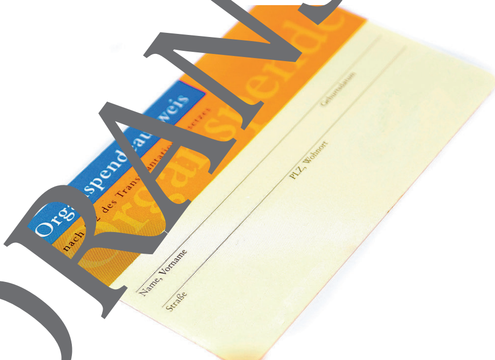
Abbildung eines Organspendeausweises