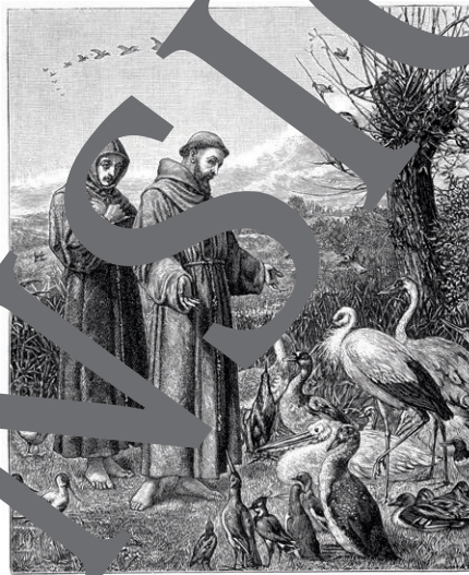
ST. FRANCIS PREACHING TO THE BIRDS.

Franz von Assisi wurde 1181 oder 1182 in Assisi, einer Stadt in Italien, geboren. Er wuchs in wohlhabenden Verhältnissen auf. Bedingt durch Kriegserfahrungen wendete er sich aber immer mehr dem Glauben zu und richtete sein Leben auf Jesus aus. Eine Textstelle aus dem Matthäusevangelium berührte ihn dabei besonders: „Steckt nicht Gold, Silber und Kupfermünzen in euren Gürtel! Nehmt keine Vorratstasche mit auf den Weg, kein zweites Hemd, keine Schuhe, keinen Wanderstab; denn wer arbeitet, ist seines Lohnes wert.“ (Matth. 10,8,9-10). Armut wurde für Franz oberstes Prinzip und immer mehr Menschen folgten ihm. Franz und seine Anhänger zogen sich immer wieder in die Natur zurück und lebten in einfachen Hütten. Diese Verbundenheit mit der Natur war ihm besonders wichtig. Im Jahr 1223 sollte die Weihnachtsmesse im Freien mit lebenden Tieren gefeiert haben. Eine Legende besagt, dass er sogar Vögeln gepredigt haben soll und diese seine Worte verstanden haben. Aufgrund seiner Lebensweise wurde Franz von Assisi im Jahr 1979 zum Patron des Umweltschutzes und der Ökologie der katholischen Kirche ernannt.